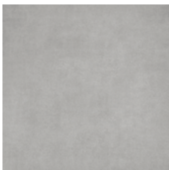
GREIGE 60NGR 60x60 nat. 50