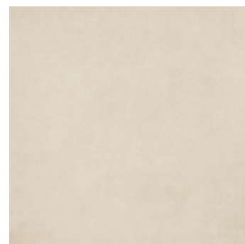
BEIGE 60NB 60x60 nat. 50