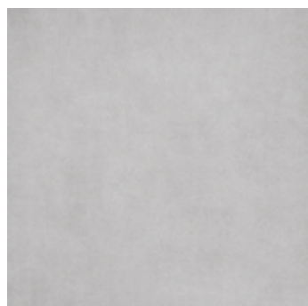
GREY 60NG 60x60 nat. 50