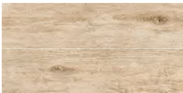
GREEN ACERO 20,2x80,2