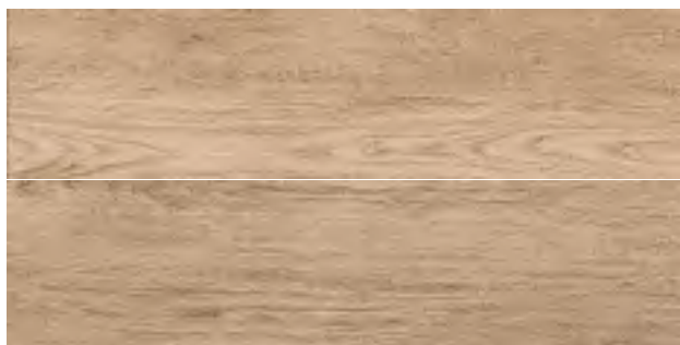
GREEN AFRORMOSIA 20,2x80,2