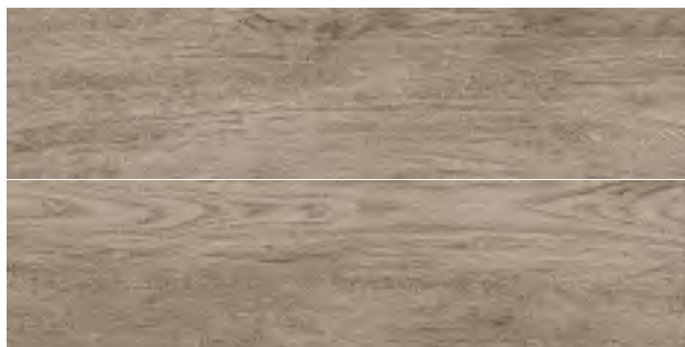
GREEN PALISSANDRO 20,2x80,2

GRES PORCELLANATO // PORCELAIN STONEWARE / FEINSTEINZEUG / GRÈS CÉRAME