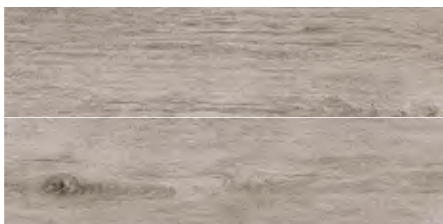
GREEN OLMO 20,2x80,2