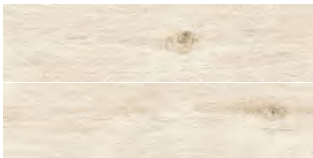
GREEN FRASSINO 20,2x80,2

GRES PORCELLANATO // PORCELAIN STONEWARE / FEINSTEINZEUG / GRÈS CÉRAME