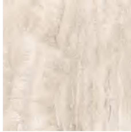
CLASSICA TRAVERTINO 60x60 92 60CLT lap. ret.

LA PRESENZA NON COSTANTE DI PUNTINI SULLA SUPERFICIE DEL PRODOTTO È DA RITENERSI CARATTERISTICA DEL PRODOTTO STESSO, IN QUANTO QUEST'ULTIMO È OTTENUTO MEDIANTE LEVIGATURA LEGGERA (LAPPATURA) CHE NON AFFONDA COMPLETAMENTE NELLO SMALTO. QUESTA SCARSA PRESSIONE DA PARTE DELLE MOLE PERMETTE ALLA SUPERFICIE DI ESSERE COMPLETAMENTE LUCIDA, MA ALLO STESSO TEMPO DI RAGGIUNGERE IL MIGLIOR COMPROMESSO IN FATTO DI RESISTENZA ALLE MACCHIE E ASSORBENZA. FORMATO DI PRESENTAZIONE 60X60 RETT. IL MATERIALE È PRODOTTO IN ITALIA ED È CONFORME ALLE NORMATIVE VIGENTI.