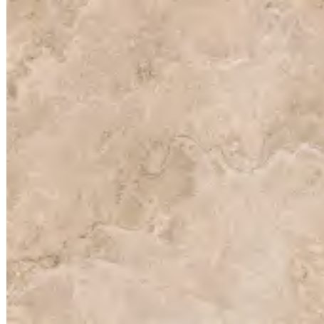
CLASSICA RAPOLANO 60x60