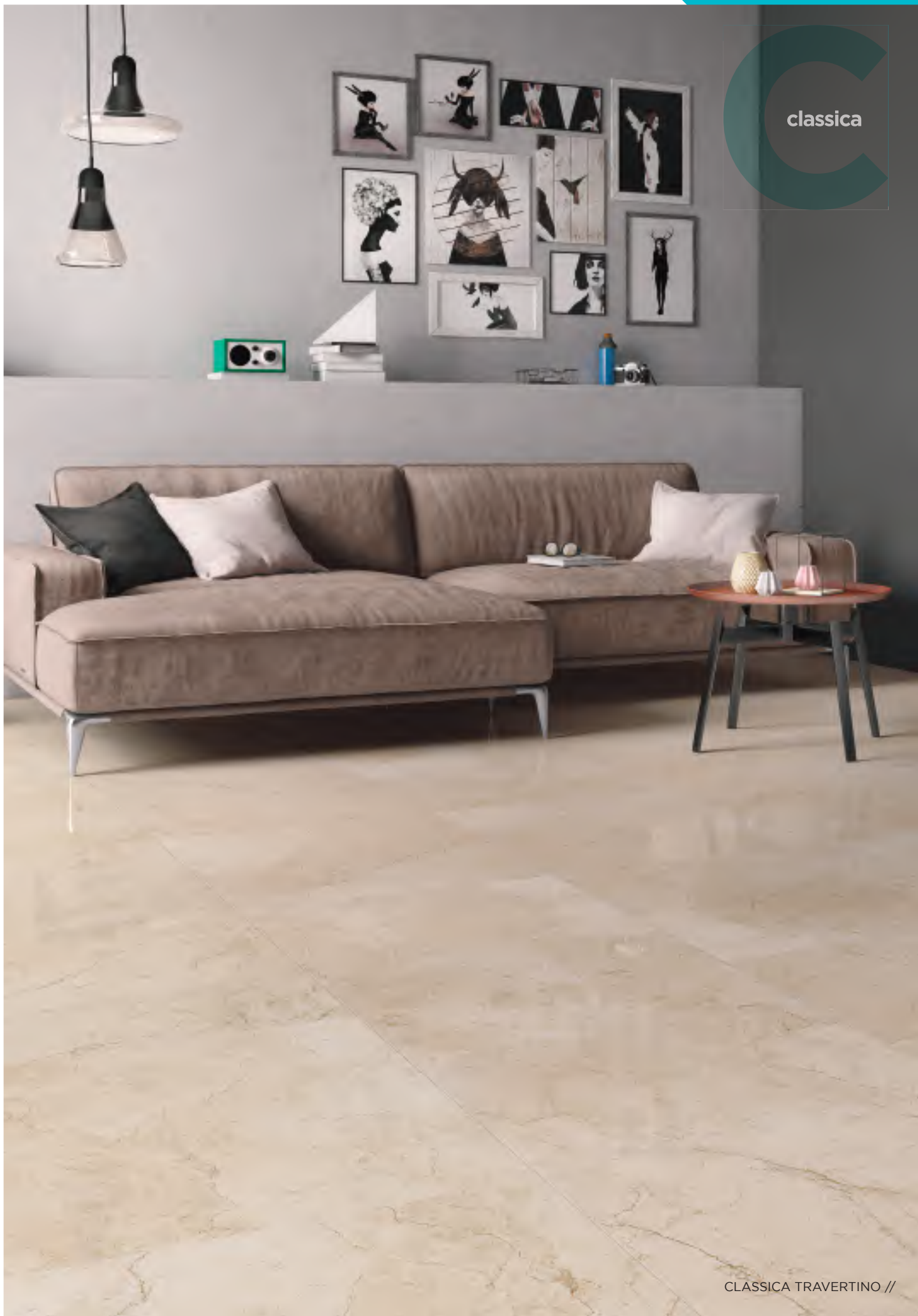
CLASSICA TRAVERTINO //