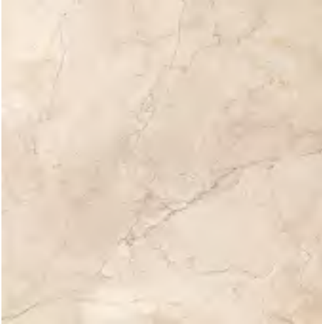
CLASSICA MARFIL 60x60