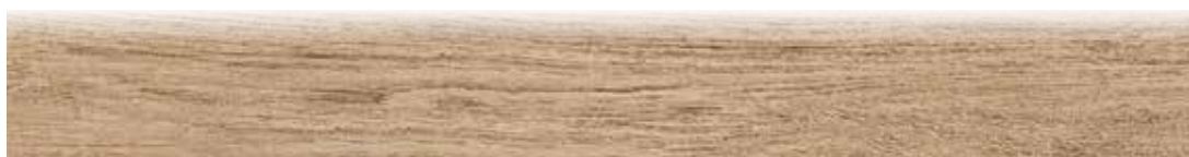
1080BAF BATTISCOPA GREEN AFRORMOSIA 10x80,2