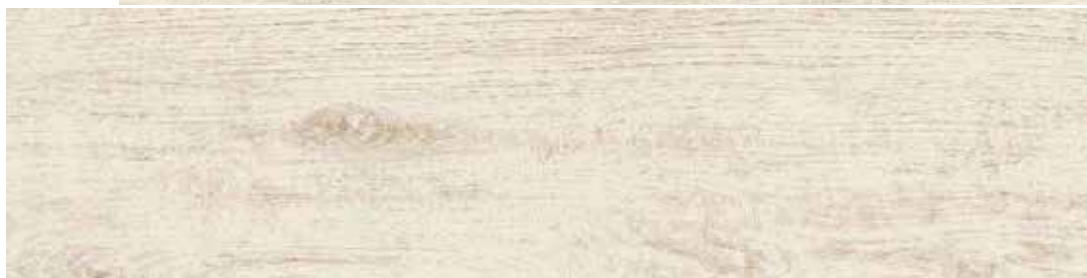
2080F GREEN FRASSINO 20,2x80,2