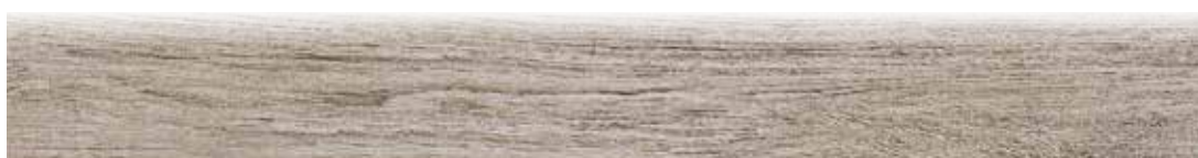
1080BP BATTISCOPA GREEN PALISSANDRO 10x80,2