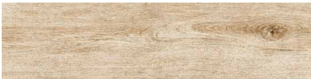
2080A GREEN ACERO 20,2x80,2