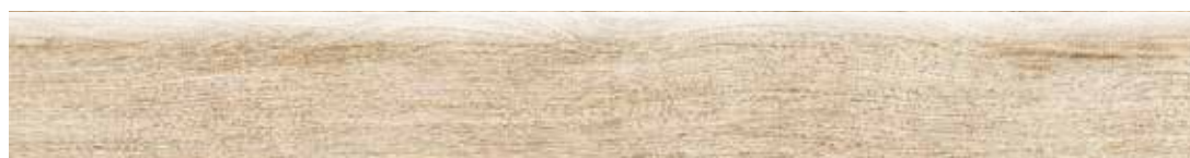
1080BA BATTISCOPA GREEN ACERO 10x80,2