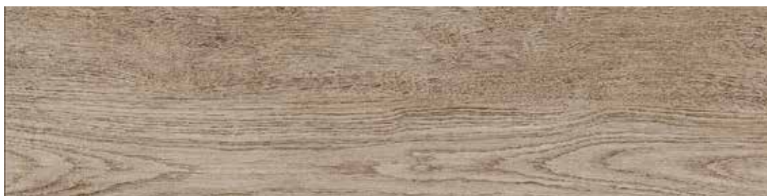
20800 GREEN OLMO 20,2x80,2