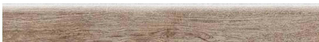
1080B0 BATTISCOPA GREEN OLMO 10x80,2