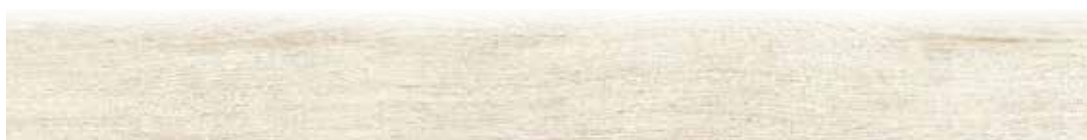
1080BF BATTISCOPIA GREEN FRASSINO 10x80,2