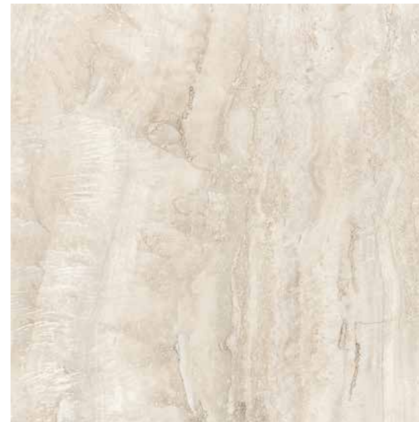
60CLT CLASSICA TRAVERTINO 60x60 RETTIFICATO LAPPATO