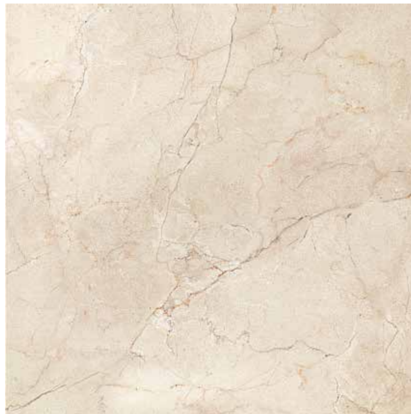
60CLM CLASSICA MARFIL 60x60 RETTIFICATO LAPPATO