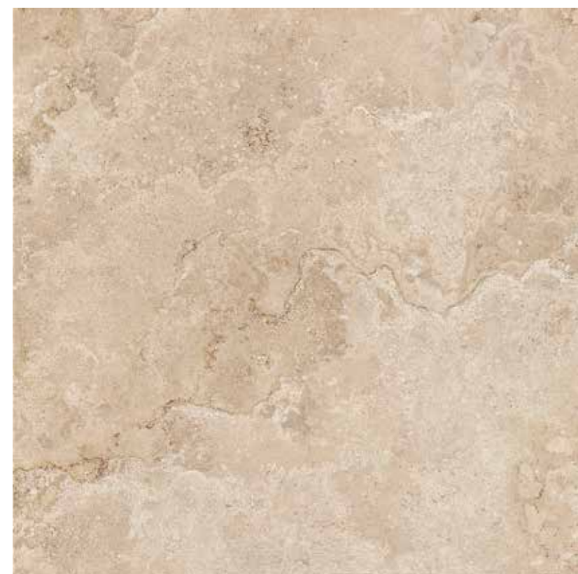
60CLRA CLASSICA RAPOLANO 60x60 RETTIFICATO LAPPATO