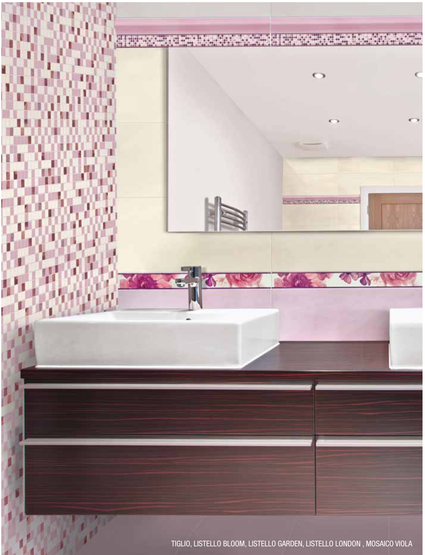
TIGLIO, LISTELLO BLOOM, LISTELLO GARDEN, LISTELLO LONDON , MOSAICO VIOLA

SPESSORE . thickness . Stärke . épaisseur 9 MM