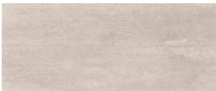
2560MC CROMO 25x60