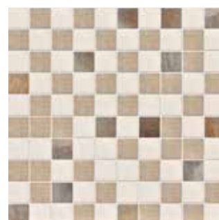
25MMCR CROMO MOSAICO 25x25