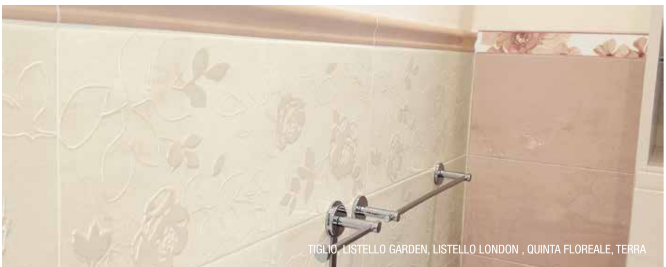
TIGLIO, LISTELLO GARDEN, LISTELLO LONDON , QUINTA FLOREALE, TERRA