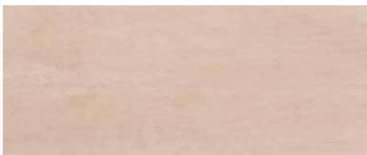
2560MTR TERRA 25x60