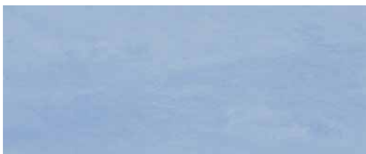
2560MD DENIM 25x60