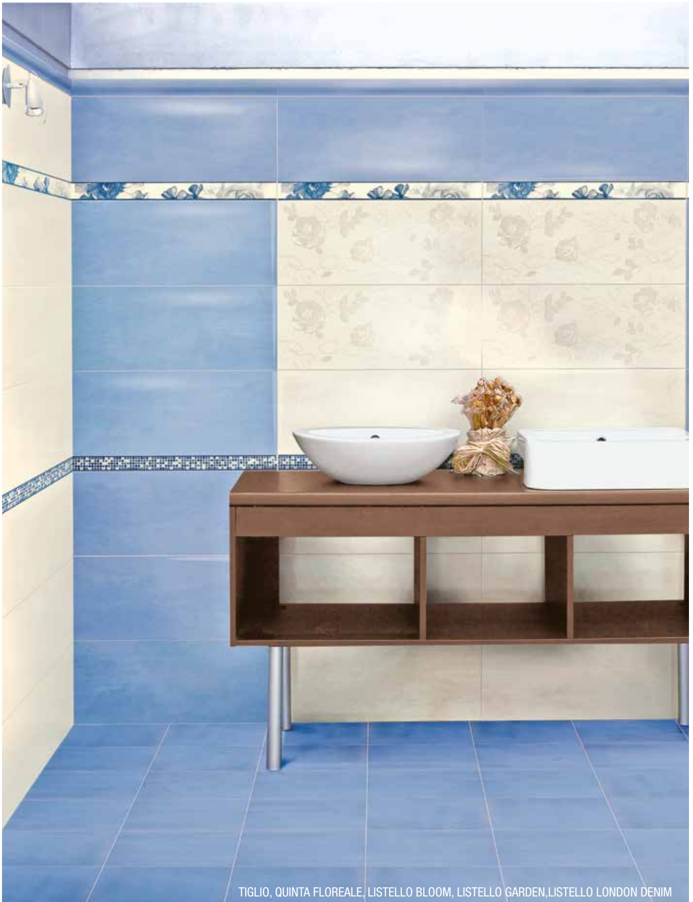
TIGLIO, QUINTA FLOREALE, LISTELLO BLOOM, LISTELLO GARDEN, LISTELLO LONDON DENIM

SPESSORE . thickness . Stärke . épaisseur 9 MM