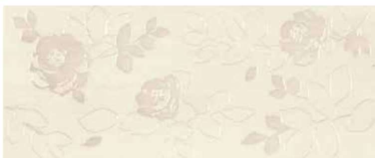
2560FM QUINTA FLOREALE MAGNIFICA 25x60