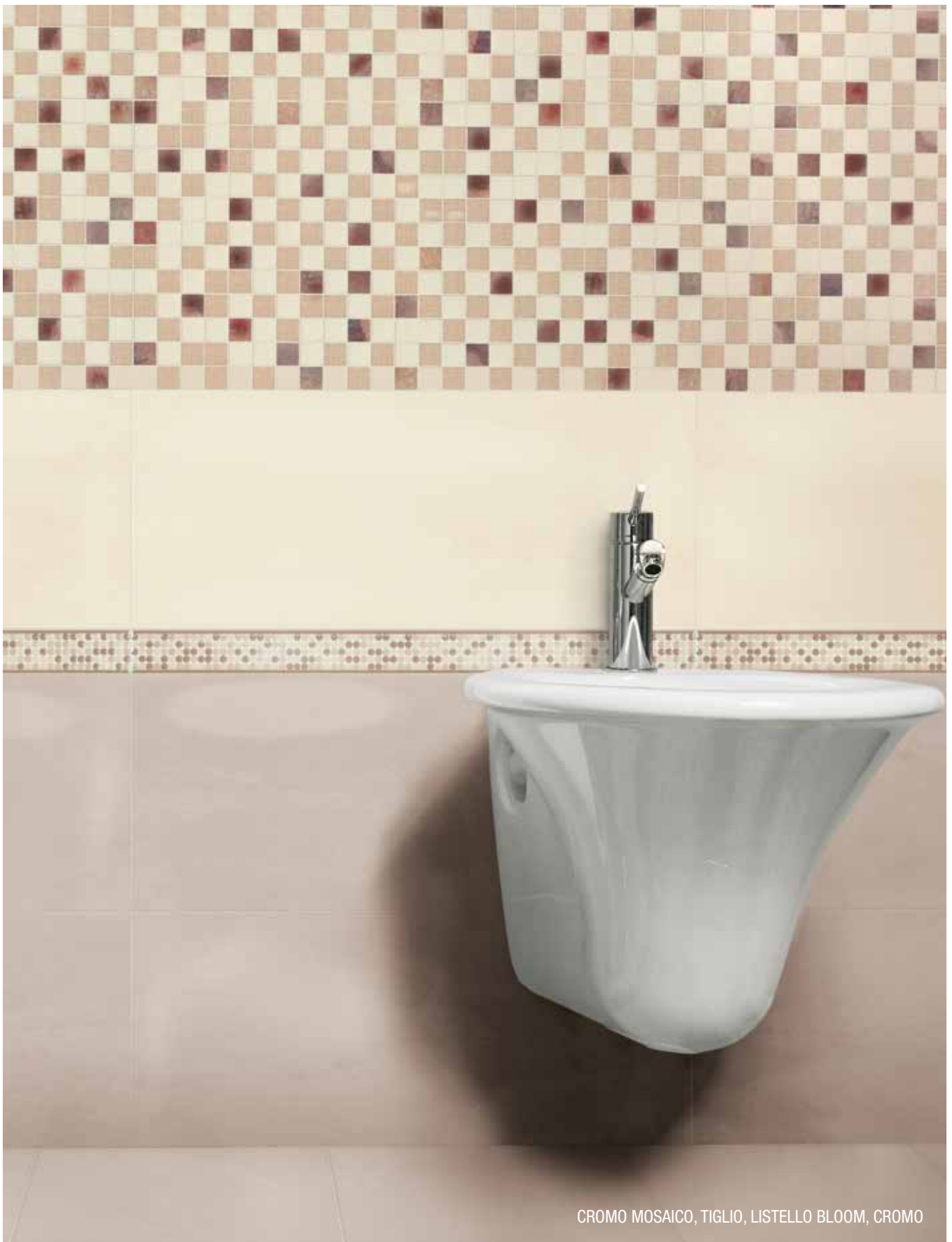
CROMO MOSAICO, TIGLIO, LISTELLO BLOOM, CROMO

SPESSORE . thickness . Stärke . épaisseur 9 MM