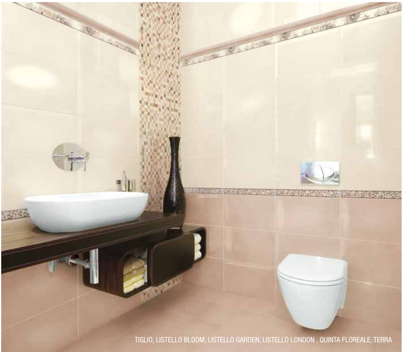
TIGLIO, LISTELLO BLOOM, LISTELLO GARDEN, LISTELLO LONDON , QUINTA FLOREALE, TERRA

SPESSORE . thickness . Stärke . épaisseur 9 MM