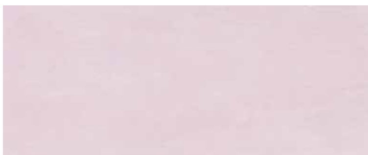
2560MV VIOLA 25x60