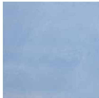
33MD DENIM 33x33