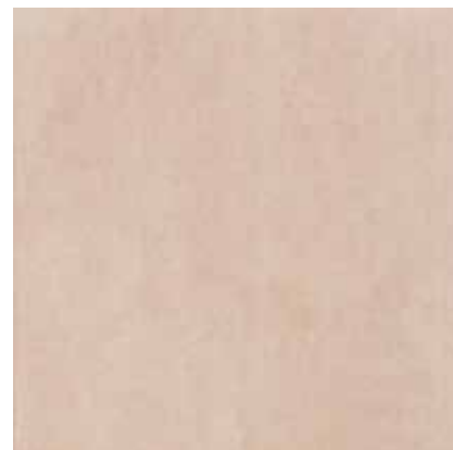
33MT TERRA 33x33