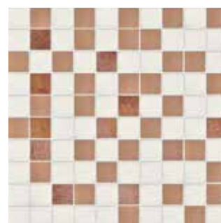
25MMT TERRA MOSAICO 25x25