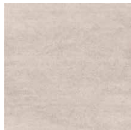
33MC CROMO 33x33