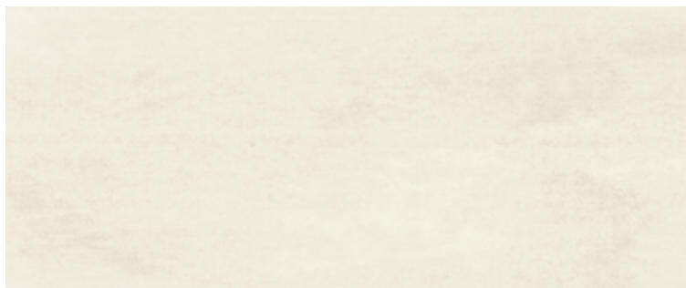
2560MT TIGLIO 25x60